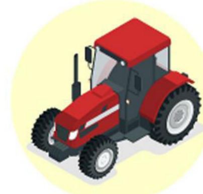
Самоходная техника**** (трактор)