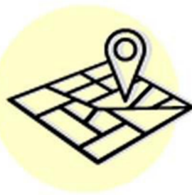
Земельные участки* не более 0,25 га общей площадью или 1 га в сельской местности