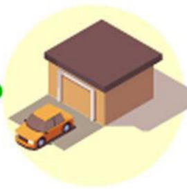
Гараж или машинное место